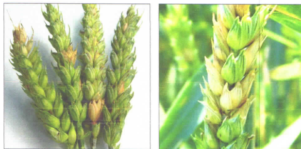
Objawy choroby na kłosach