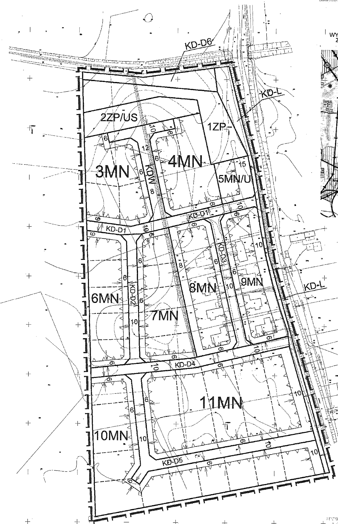
WYRYS ZE STUDIUM UWARUNKOWAŃ I KIERUNKÓW ZAGOSPODAROWANIA PRZESTRZENNEGO GMINY INOWROCŁAW